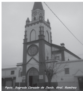
Paróquia Sagrado Corazón de Jesús, Gral. Ramírez